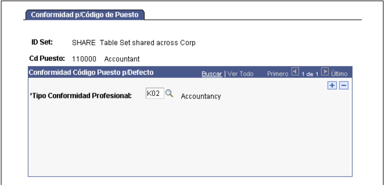
Página Conformidad p/Código de Puesto

Acceda a la página Conformidad p/Código de Puesto.