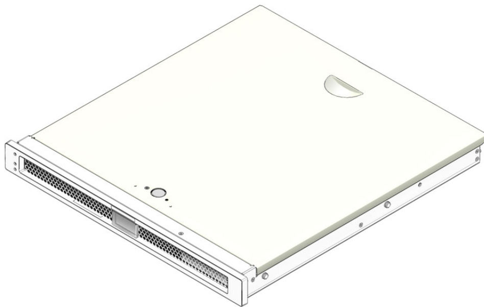
图 1 Sun SPARC Enterprise T1000 服务器