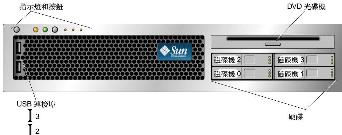
圖 1 Sun Fire T2000 伺服器正面面板