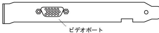
図 1-2 Sun PGX64 の背面板

図 1-2 に、Sun PGX64 グラフィックスカードの背面板および HD15 モニター用コネクタを示します。