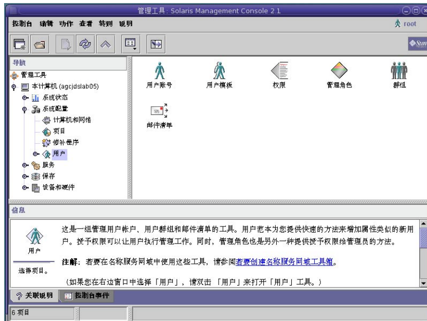
图 2-1 Solaris Management Console 用户工具