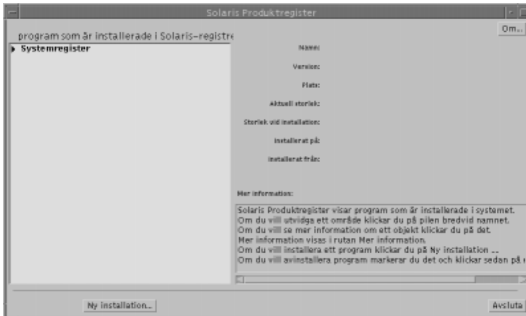
Figur 3-1 Ursprunglig konfiguration av Solaris Produktregister

Du visar objekten i produktregistret genom att klicka på triangeln till vänster om "Systemregister". Observera att triangeln nu pekar nedåt i stället för till höger. Du kan visa innehållet i alla objekt i registret som är försedda med trianglar som pekar till höger på det här sättet. Du kan dölja innehållet i objekt som har en triangel som pekar nedåt genom att klicka på triangeln. Om det finns en kvadrat till vänster om ett objekt kan du inte visa eller dölja innehållet i det.