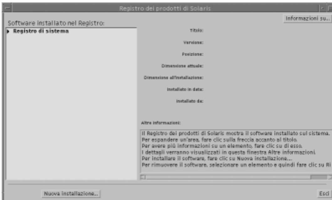
Figura 5-1 Configurazione iniziale del Registro dei prodotti di Solaris

La finestra principale, raffigurata qui sotto nella Figura 5-1, è divisa in tre aree di informazioni: un elenco del software installato e registrato, gli attributi standard del software correntemente selezionato, e un'area in cui sono elencati gli attributi personalizzati e gli attributi interni del software registrato.