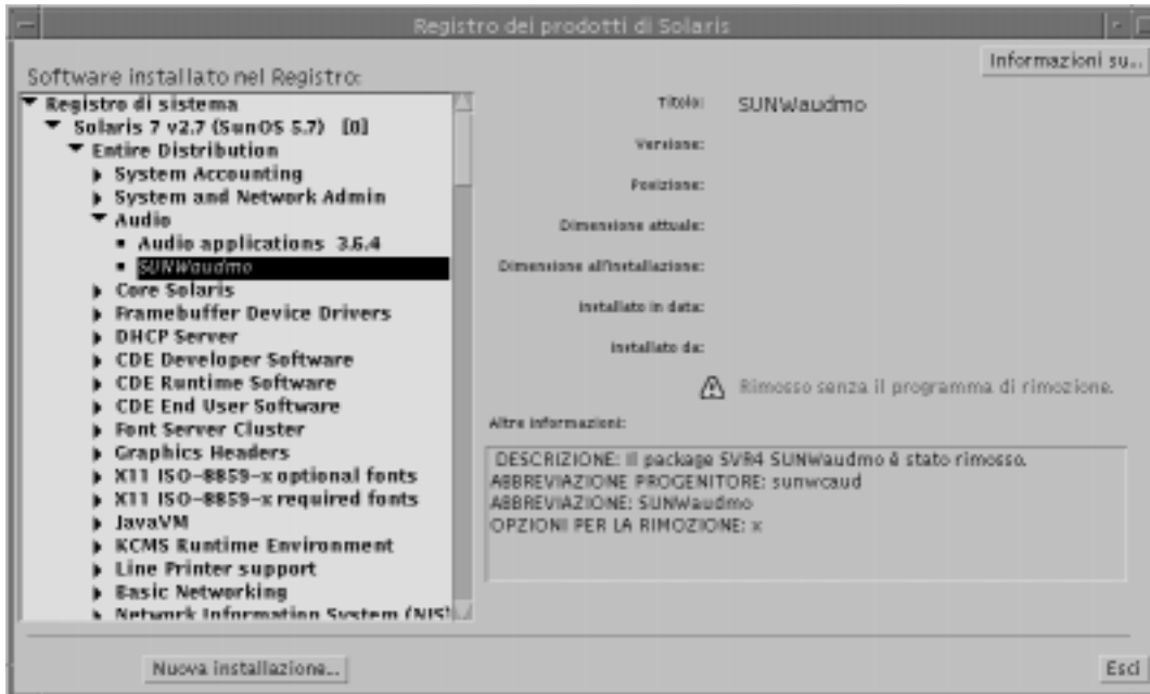
Figura 5-3 Messaggio di file mancanti nel Registro dei prodotti di Solaris

A volte, nella finestra del Registro dei prodotti appaiono prodotti software che in realtà sono stati rimossi manualmente o con il comando pkgrm . In questo caso, sotto l'attributo "Installato da:" compare un'icona indicante la mancanza di file (vedere qui sotto la Figura 5-3). È possibile reinstallare il software usando il comando pkgadd oppure rimuoverlo usando il Registro.