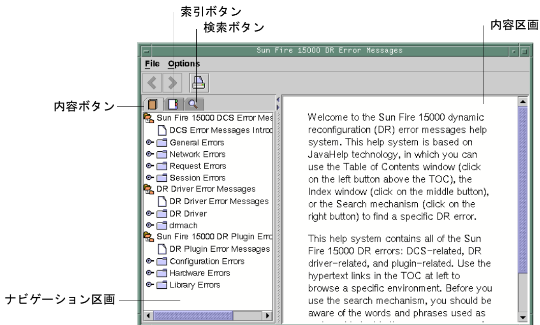
図 3-1 hsviewer GUI コンポーネント

DR エラーメッセージヘルプシステムの表示には、標準的な JavaHelp システムビューア hsviewer が使用されます。このビューアは、図 3-1 に示すように、ツールバーと 2 つの区画、内容区画とナビゲーション区画からなります。