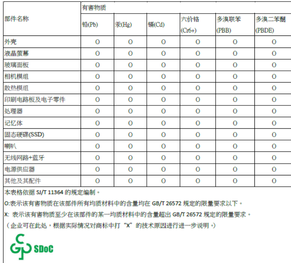
表格 1 有害物质名称及含量标识格式

Note: This table is a regulatory document required for products shipped to the People's Republic of China.