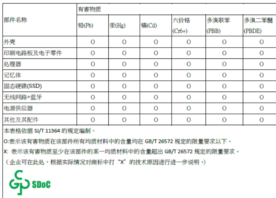
表格 1 有害物质名称及含量标识格式

Note: This table is a regulatory document required for products shipped to the People's Republic of China.