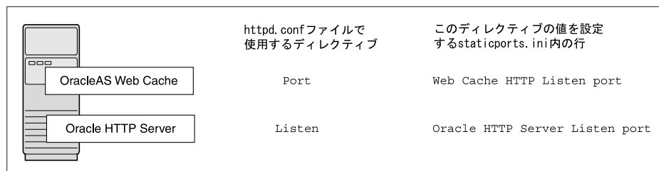
図 3-1 OracleAS Web Cache および Oracle HTTP Server の両方を構成する場合

Oracle HTTP Server Listen (SSL) port = port_number