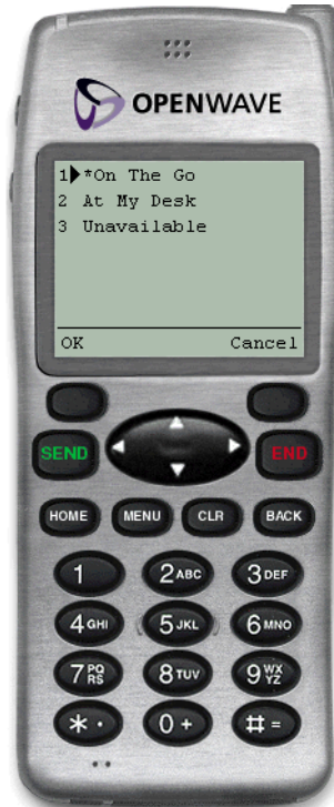
図 2-2 デバイスからの連絡ルールを選択

確認画面に、新しい連絡ルールが表示されます。メイン・メニューに戻るには、「OK」をクリックします。