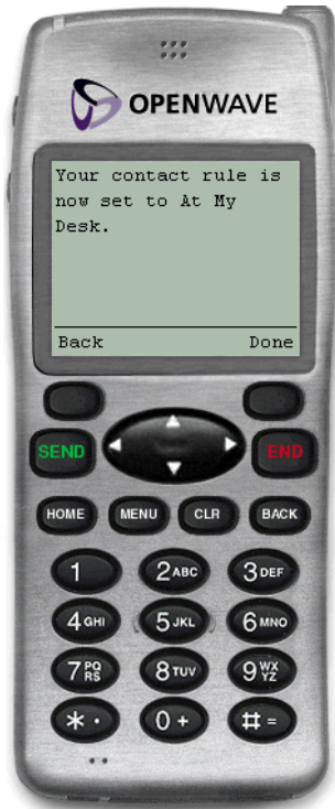
図 2-3 確認ページ（デバイスより）